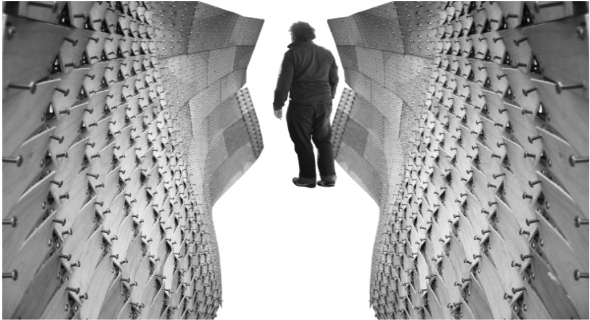
Ryc. 2. Meta-patch -projekt Joseph Kellner i Dave Newton.

Prawdopodobnie w dziedzinie poszukiwania systemów materiałów architekturze przyjdzie z pomocą dziedzina biochemii, której obszarem zainteresowania są, między innymi procesy umożliwiające żyjącym istotom przetrwanie.