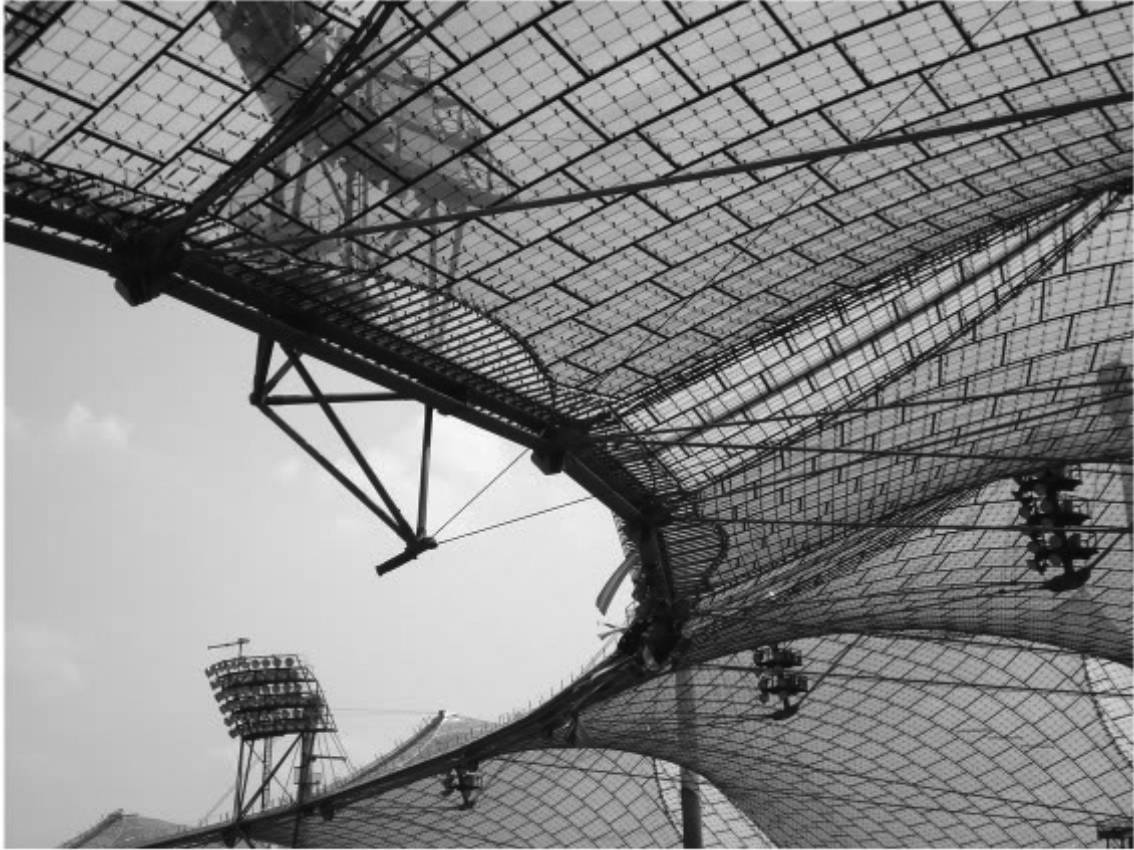
Ryc. 3. Struktura zadaszenia Stadionu Olimpijskiego w Monachium projektu Freia Otto. (źródło: http://media.photobucket.com/image/frei%20otto/dorlev_divad/DSC01230.jpg )